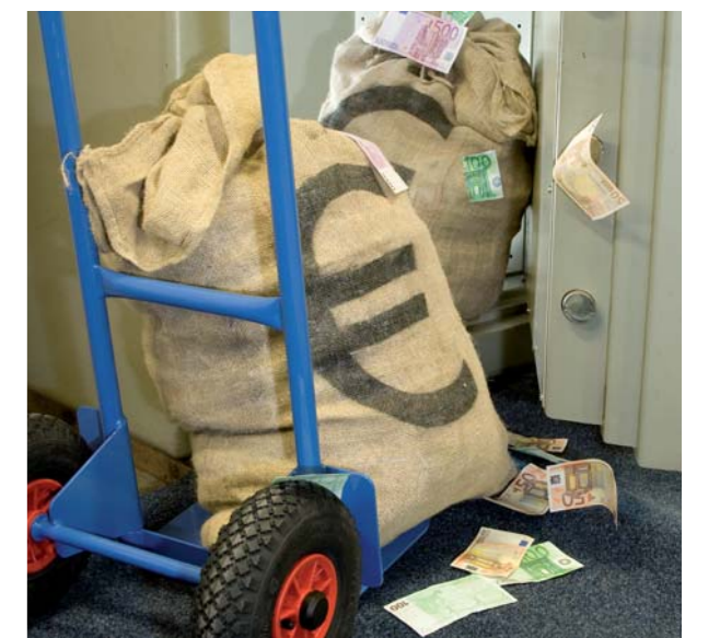
| HOEZO CREDITCRISIS? |