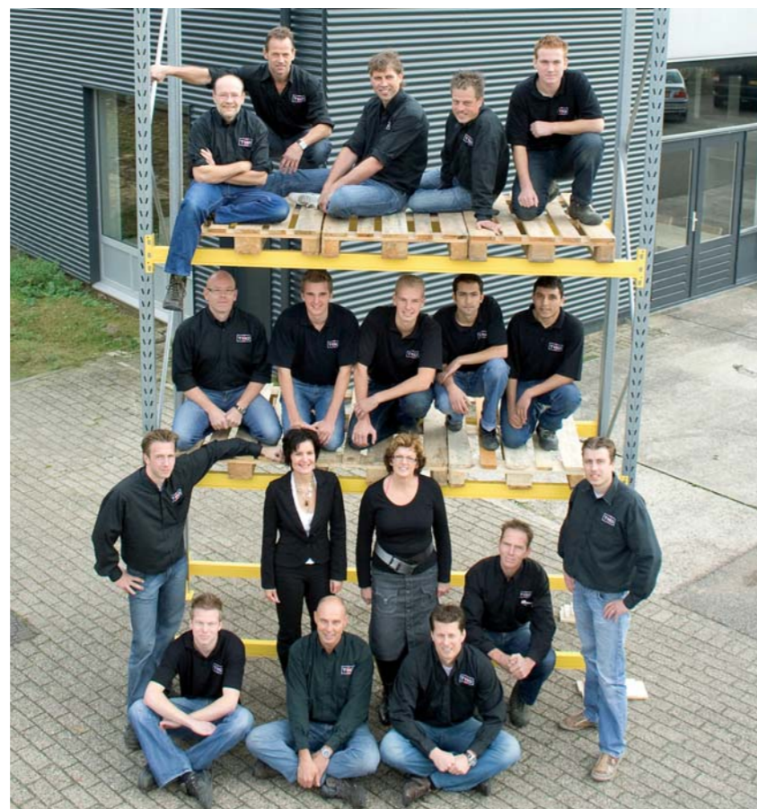
| TERBORG |

Naast de showroom met magazijnen in Terborg, bestaat er voor met name de klanten in het KAN-gebied de mogelijkheid om de showroom in Huissen te bezoeken. Hier wordt de scepter